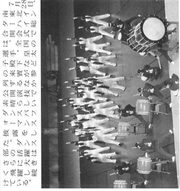
総台開会式 公開演技の様子

あなたは大丈夫？ 現在、私たちが当たり前に使っているスマートフォン。(以下スマホとする)とても便利だが、健康に悪影響を及ぼしていることを知っているだろうか。使すぎていると、次のような悪影響を及ぼすといわれている。 1 ストレートネック 長い時間うつむいた姿勢でスマホの画面を見ていると本腰が丸くなり、猫背になる傾向がある。猫背は見た目が悪くなるだけでなく、肩こり、頭痛、血行不良などの原因になる。 2 不眠症 画面から放たれるブルーライトは、睡眠のリズムが崩れる原因となる。寝る前にスマホを使うことで、知らぬうちに眠りにくい状態になり、 3 安眠を妨げる。 3 視力低下 スマホに表示されている文字の大きさは小さい。この小さな文字を長時間見続けていると、目が非常に疲れる。それが原因で視力低下になる危険性がある。 4 肩こり・頭痛・血行不良 スマホの画面を見るとき、背中が丸くなり、猫背になる傾向がある。猫背は見た目が悪くなるだけでなく、肩こり、頭痛、血行不良などの原因になる。 5 小指変形 スマホを持つときに、小指への負担がかかり、変形してしまう。 6 人体・健康問題への危険 電磁波過敏症